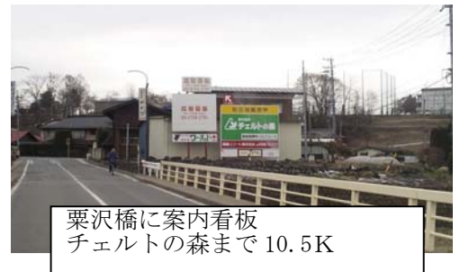
栗沢橋に案内看板 チェルトの森まで10.5K