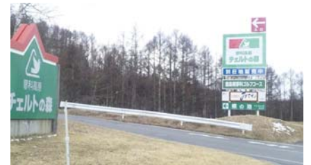
チェルトの森入り口