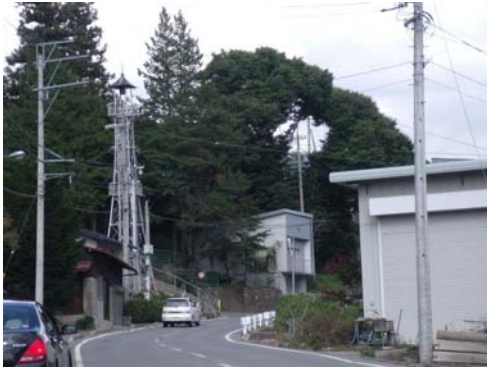
188 号線火の見やぐら