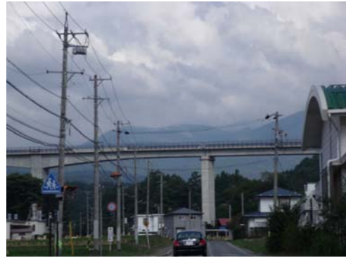
188 号線を走ると八ヶ岳エコー ラインの大きな橋をくぐる