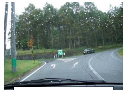
三差路を右へ右へ