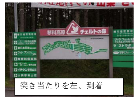
突き当たりを左、到着